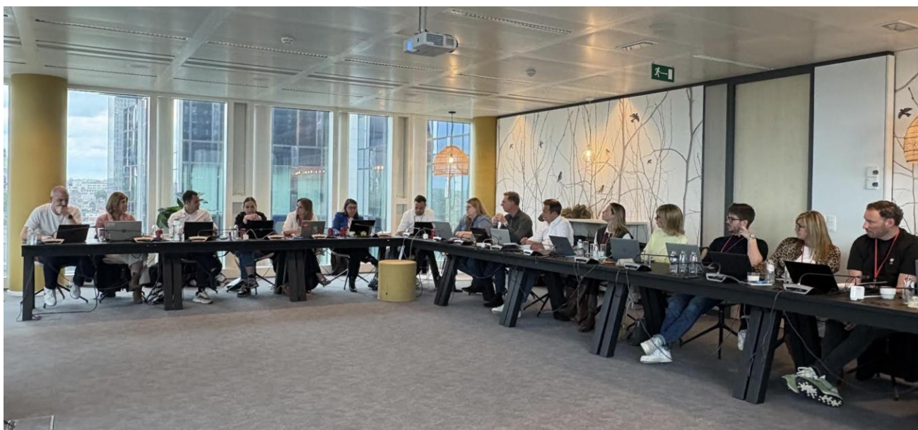
Le jury des AMMA au travail dans le ENGIE Skyroom

Pour cette catégorie les nominations et les trophées remportés dans les autres catégories des AMMA rapportent des points supplémentaires aux suffrages du jury.